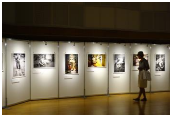
イシュ パテル 写真展