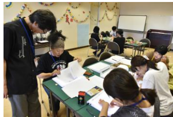
ワークショップ キッズ・クリップ